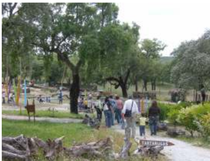
Figura 1 – Perspectiva do parque pequeno

Para além das preocupações com os seus “habitantes”, o Monte Selvagem preocupa-se também com o bem-estar de todos os visitantes, caracterizando-se por ser um espaço acessível para receber inclusivamente pessoas com deficiência motora.