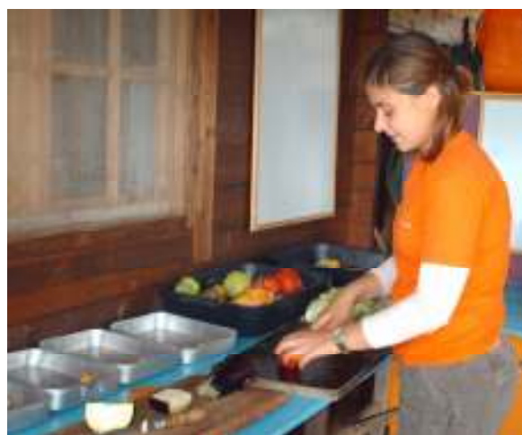
Figura 10 – Preparação dos tabuleiros dos animais Fonte: Elaboração própria

Logo de início foi-nos explicado como proceder à preparação dos alimentos. Cada animal tem necessidades especiais e por isso havia que ter algum cuidado na forma de preparar os tabuleiros (nome atribuído ao recipiente onde o animal come). Para alguns animais, os frutos e legumes iam inteiros (como os macacos ou porcos-espinhos) para outros as verduras tinham de ser meticulosamente cortadas (como para as tartarugas e iguanas). A melhor forma de saber a forma de preparar os alimentos, era visualizar o animal (principalmente a sua boca /focinho) para perceber qual seria a melhor forma de ele os ingerir.