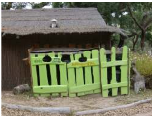
Figura 2 – Ecoponto elaborado no Monte Selvagem

Assim sendo, foi desenvolvido um projecto pedagógico (em constante melhoramento) que se encontra espalhado por todo parque nas mais diversas vertentes. Os exemplos mais simples tratam-se do bem-estar dos animais e boa manutenção das plantas, a gestão racional de recursos com conseqüente redução de desperdícios e o incentivo à separação do lixo através dos vários Ecopontos (com design próprio) espalhados pelo parque.