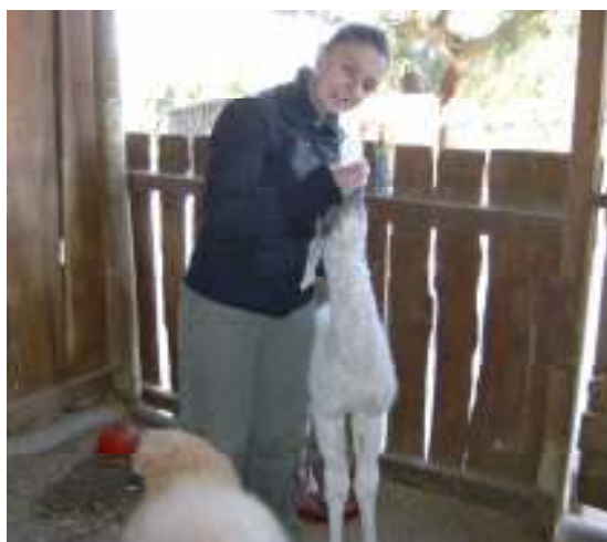
Figura 6 – Alimentando os Lamas

É de referir que existem dois turnos de trabalho, um das 8h às 17h e outro das 10h às 19h. Geralmente fazíamos parte do primeiro turno durante a semana e ao fim-de-semana integrávamos o segundo. Quando começávamos às 10h já não procedíamos à limpeza das instalações, passando directamente à preparação dos tabuleiros ou recepção dos grupos. No final do dia era ainda necessário fechar os animais da quintinha, desligar as luzes do reptilário e fechar as lebres da Patagónia. No entanto nunca podíamos deixar o parque sem que todos os seus visitantes tivessem saído.