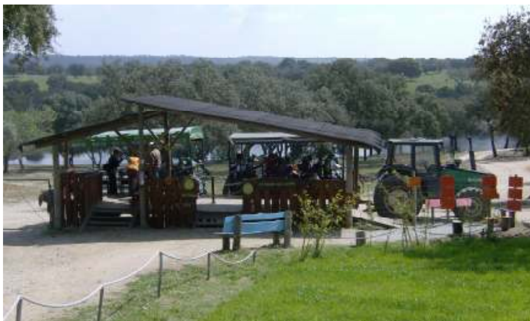
Figura 3 – Cais de Embarque e tractor para efectuar visita ao parque grande

O parque grande tem uma área de 12 ha e os animais que aí se encontram vivem em regime de semi-liberdade. Os visitantes percorrem esta parte do parque nos tractores com reboques que o Monte Selvagem disponibiliza. A visita é guiada sendo o funcionário que conduz o tractor que dá uma explicação sobre os hábitos dos animais que vai encontrando ao longo do percurso.