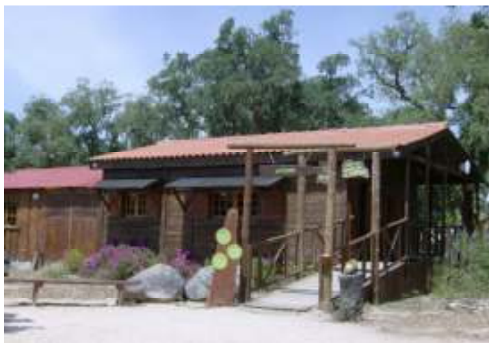
Figura 5 – Entrada para o Monte Selvagem

Fora do terreno do parque existem outras estruturas de apoio necessárias para o bom funcionamento do mesmo. São de destacar um armazém de grandes dimensões para guardar materiais diversos e alguns alimentos dos animais como rações e fardos de palha, e instalações para alojar animais pelos mais diversos motivos como por exemplo um parque de quarentenas para receber qualquer animal a introduzir no parque, instalações para isolamento de animais sujeitos a tratamento veterinários ou instalações para acolher animais apreendidos pelas autoridades.