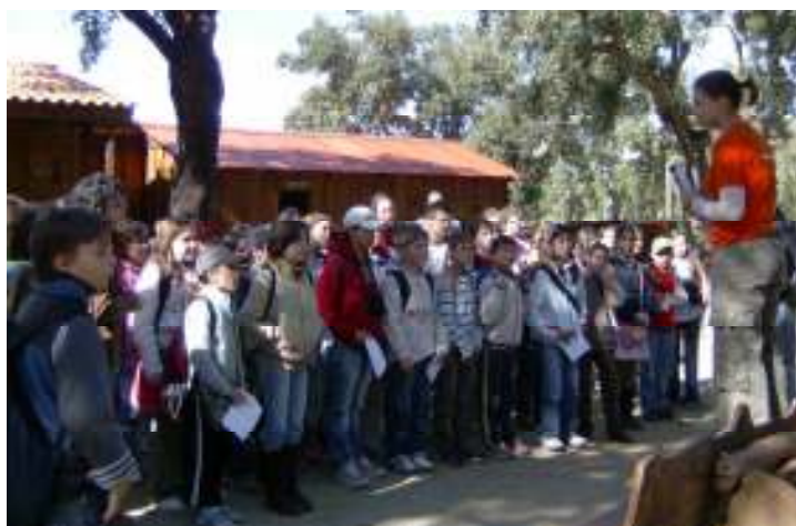
Figura 9 – Recepção aos grupos

Depois encaminhávamos o grupo para um pequeno largo na entrada onde dávamos as boas vindas, explicávamos o funcionamento do parque e distribuíamos alguns mapas. Este era um passo muito importante pois só ao início se conseguiam transmitir algumas regras para que tudo decorresse sem contratempos. Por vezes tínhamos de ser muito firmes para nos impor e forçar a que todos prestassem atenção.