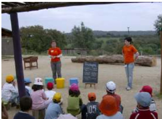
Figura 7 – Alerta Selvagem sobre Reciclagem

Comprámos uns caixotes para o lixo de cores diferentes para representar um Ecoponto e em cada caixote estava o respectivo conteúdo para mostrar exemplificado às crianças.