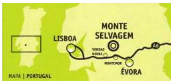
Mapa I – Localização do Monte Selvagem

Tendo em conta a natureza do parque, esta é uma localização privilegiada devido á sua proximidade com Lisboa e às acessibilidades circundantes. As auto-estradas A2 e A6 estabelecem a ligação com a capital e a A1 que passa por Santarém a 70 km também pode ser uma opção seguida depois pela Estrada Nacional 114.