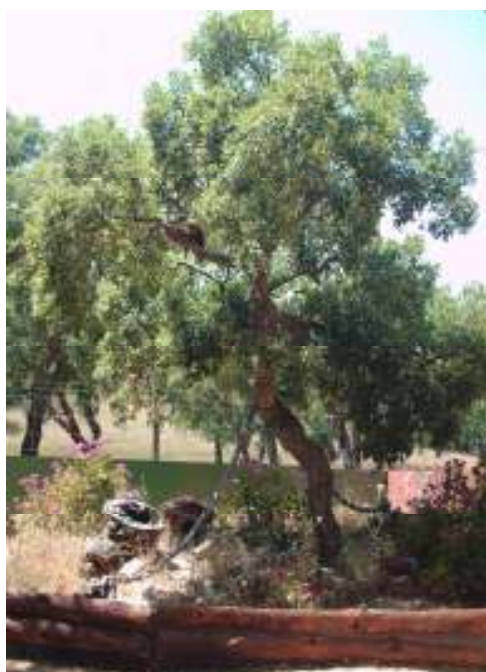
Figura 4 – Habitat Naturalista do Guaxini

Também aqui existem inúmeros equipamentos de lazer e entretenimento destinados às crianças e aos adultos como um slide, escorregas, baloiços, e no largo central jogos tradicionais como o pião, andas, o jogo do burro ou da macaca e ainda os originais Refrescadores Selvagens 9 muito práticos nos dias de calor.