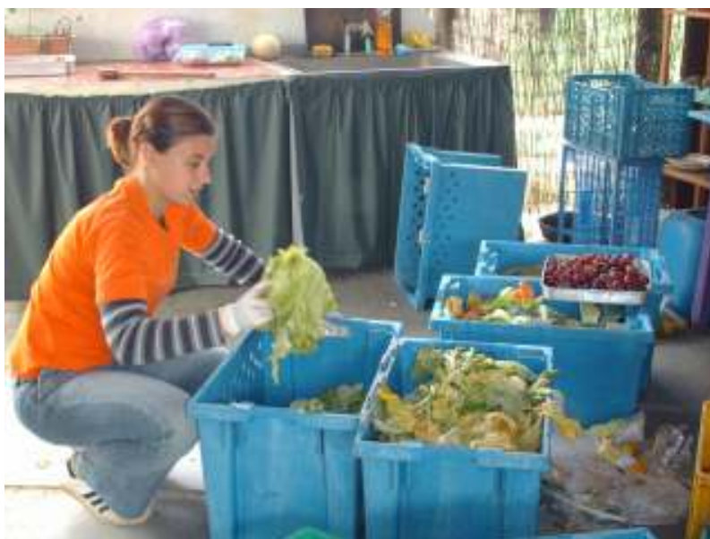
Figura 11 – Separação da fruta e legumes

Era então sempre necessário separar frutas e legumes que vão para o parque grande e pequeno conforme as necessidades dos animais. As verduras vinham muitas vezes embaladas ou atadas com pequenos plásticos e tínhamos de remover todos esses materiais que pudessem ser fatais para os animais.