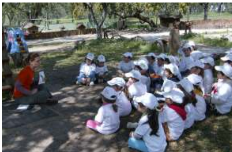
Figura 8 – Jogo dos Animais

Esta actividade realizava-se num local tranquilo e com sombra.